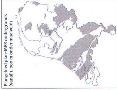
Plangebied plan-MER ondergronds (vanaf 1.000 m onder maaiveld)