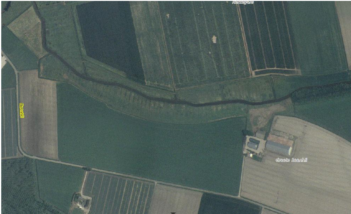
Luchtfoto uit 2000.

Het betreft het in strijd met de bepalingen van het bestemmingsplan omzetten van natte graslanden tot akkerbouwgrond. Zie het gebied ten zuiden van de Nauwe Beek, een waterloop van linksboven in de foto naar rechts midden.