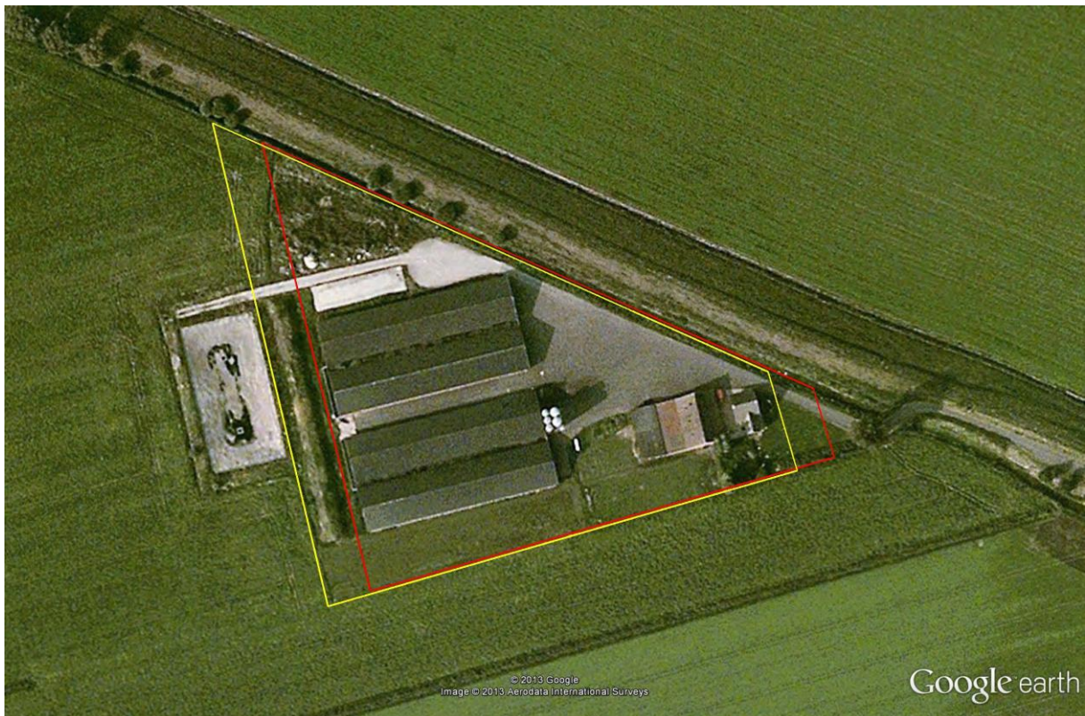
Tekening 3. Vergelijking van de bouwblokken.

Om beide bouwblokken goed te kunnen vergelijken zijn ze in Google Earth gevisualiseerd. Zie tekening 3. Hier ziet u dat door de verschuiving aan de korte oostzijde een kleine oppervlakte van het bouwblok afgaat, maar aan de westzijde een grote oppervlakte wordt toegevoegd. Het vergroten van een bouwblok van een intensieve veehouderij is in strijd met het beleid van gemeente en provincie.